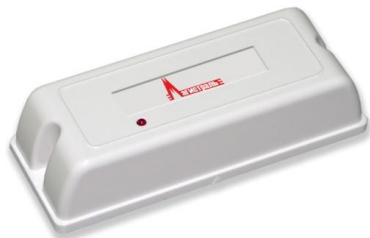
НР и НЗ контакты